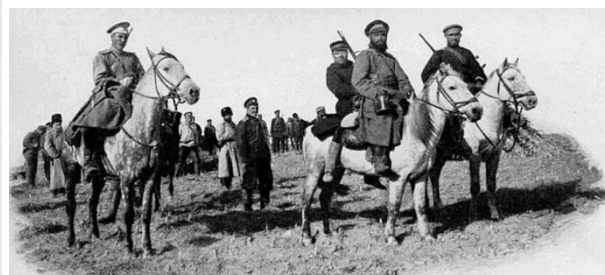
ЯПОНЦА ПОЙМАЛИ...