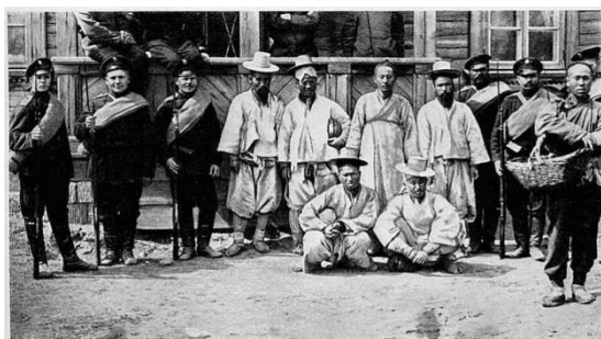
КОРЕЙЦЫ-ШПЫНЫ, ПОЙМАННЫЕ ВЕЛИЗИ НОВОКОВЕВСКА И ДОСТАВЛЕННЫЕ ВОЕННОМУ ГУБЕРНАТОРУ ВЪ Г. НИКОЛЬСКЪ.